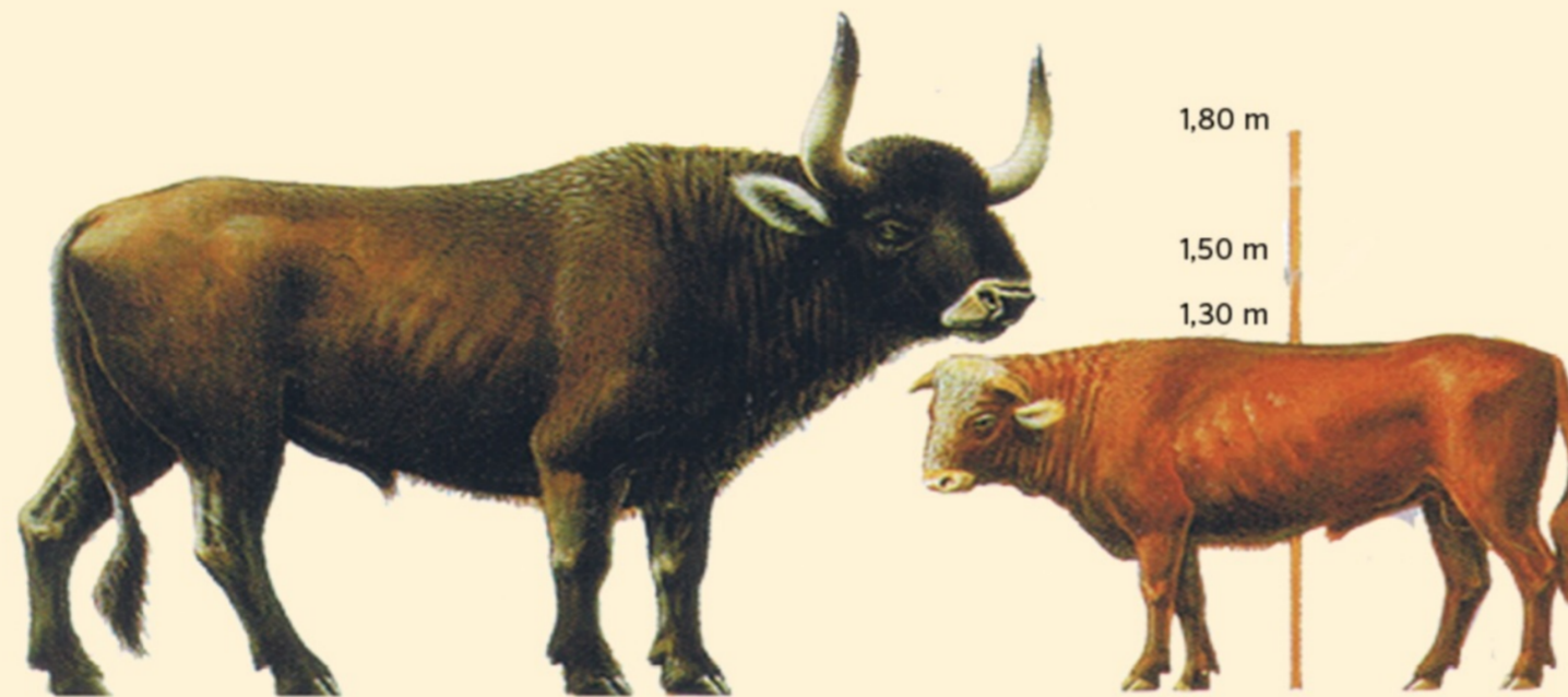
❶ Aurochs sauvage du Néolithique.